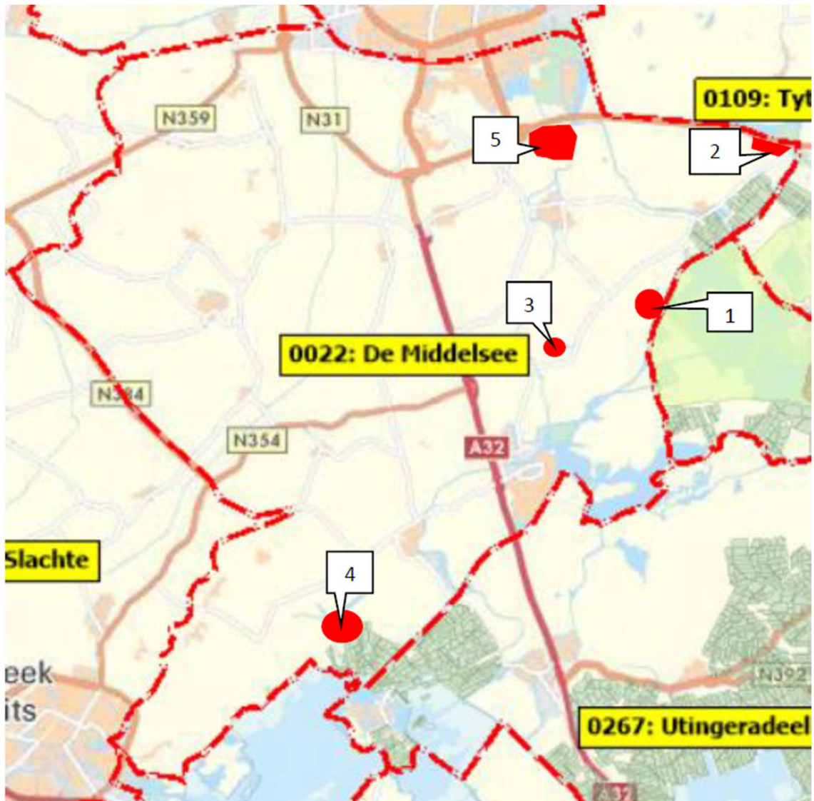
Bijlage 6: Kaart met gebieden en omschrijving waar geen beheer plaats vindt