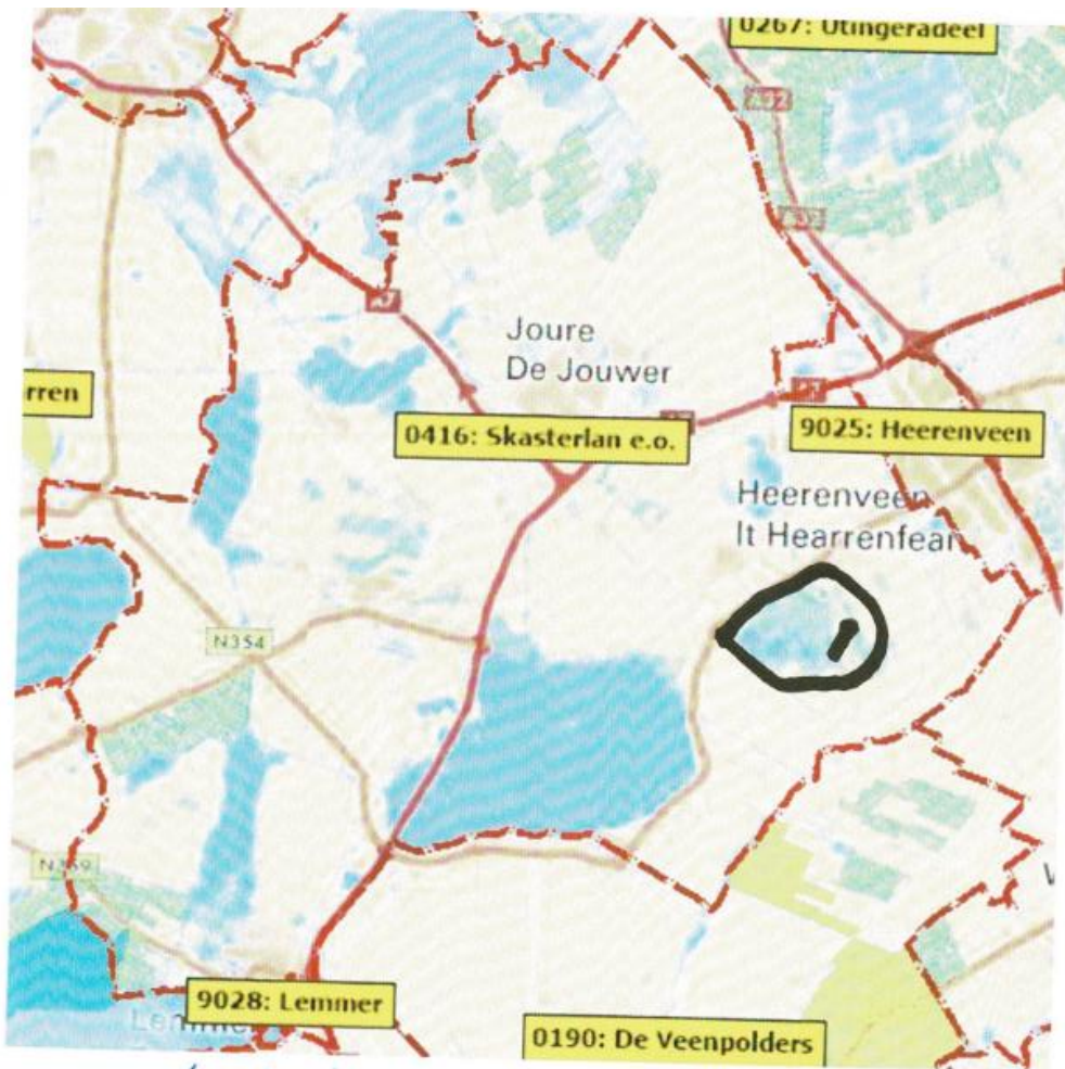
Bijlage 6: Kaart met gebieden en omschrijving waar geen beheer plaats vindt